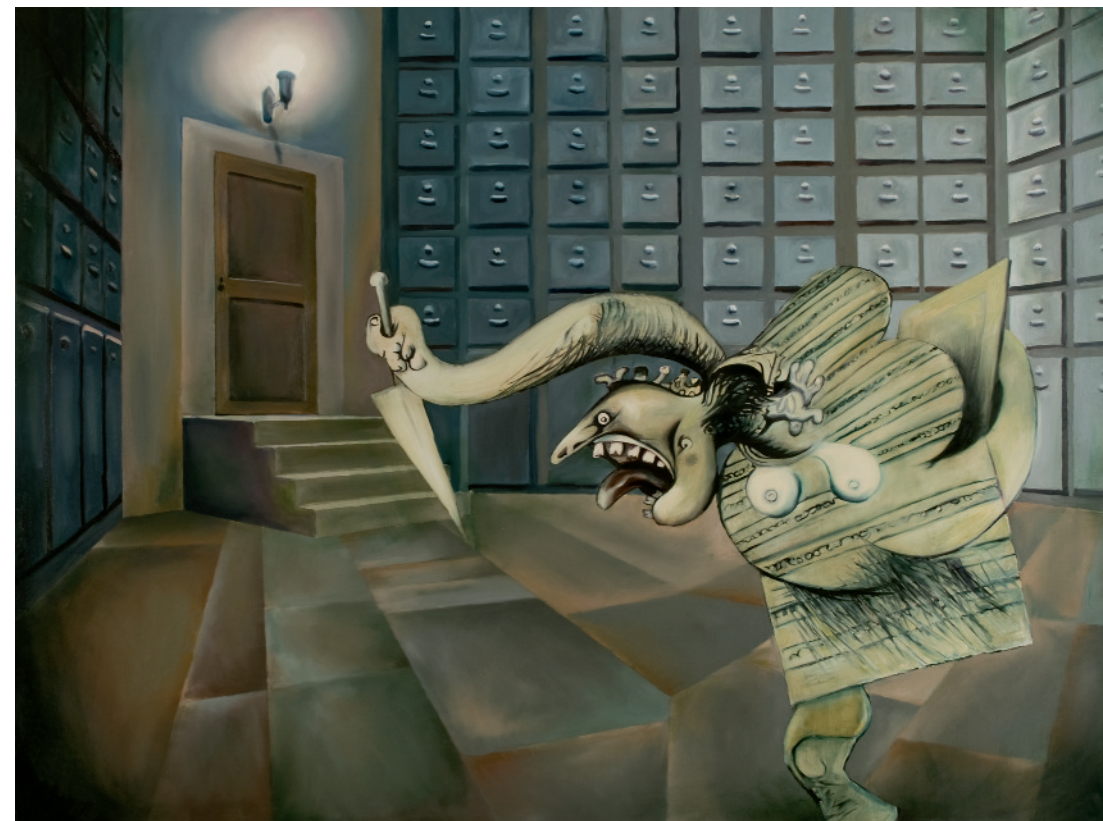
La Perspective pense, 2010 oli sobre tela, 97 x 130 cm, inv. 1415