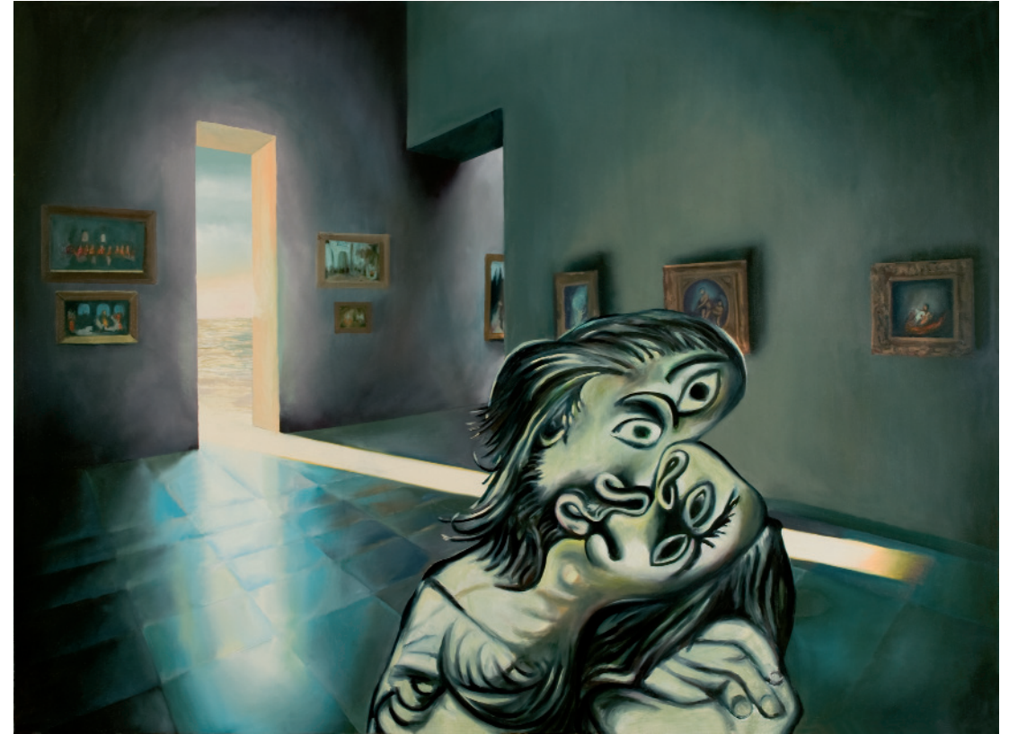
La Chambre froide de Locus Solus , 2010 oli sobre tela, 97 x 130 cm, inv. 1411