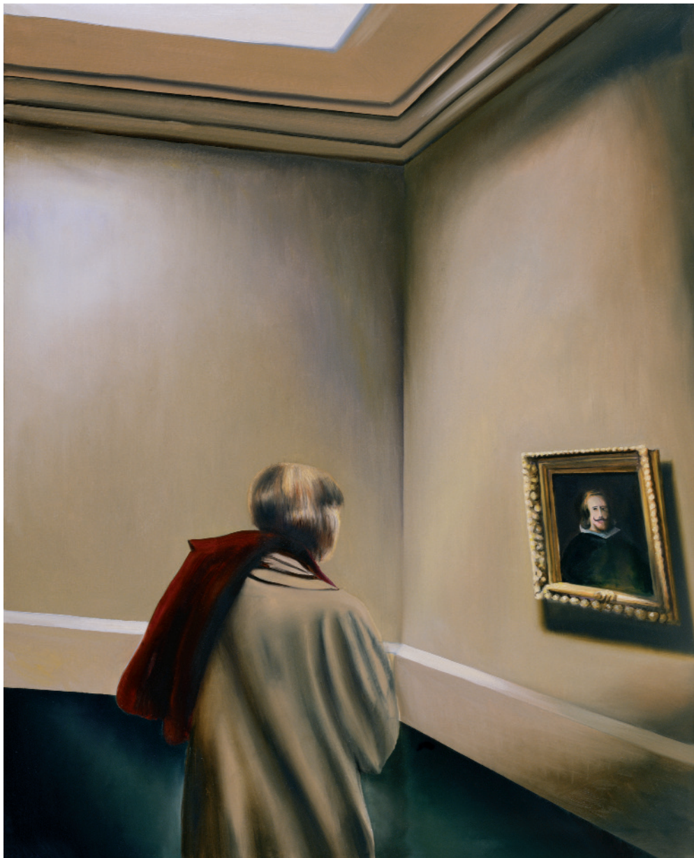
Opinion , 2008 oli sobre tela, 100 x 81 cm, inv. 1361