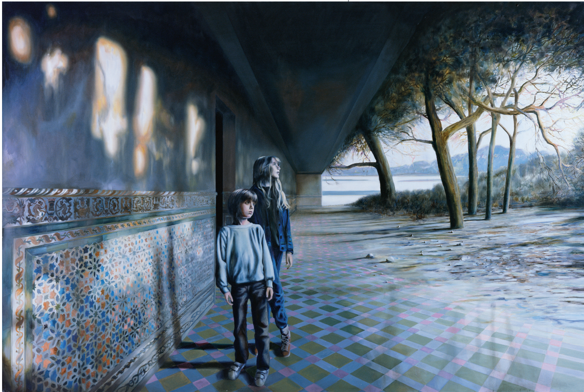
Époque historique , 2008 oli sobre tela, 200 x 300 cm, inv. 1383