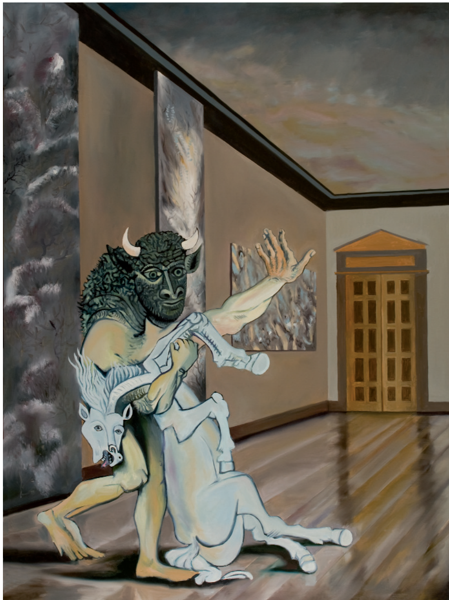
Le Minotaure, 2011 oli sobre tela, 130 x 97 cm, inv. 1423