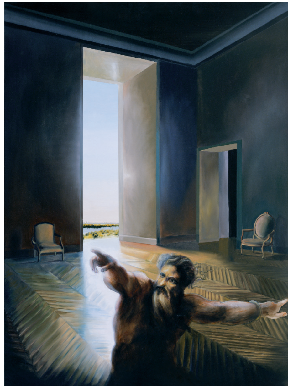
Le Situationniste , 2007 oli sobre tela, 130 x 97 cm, inv. 1354