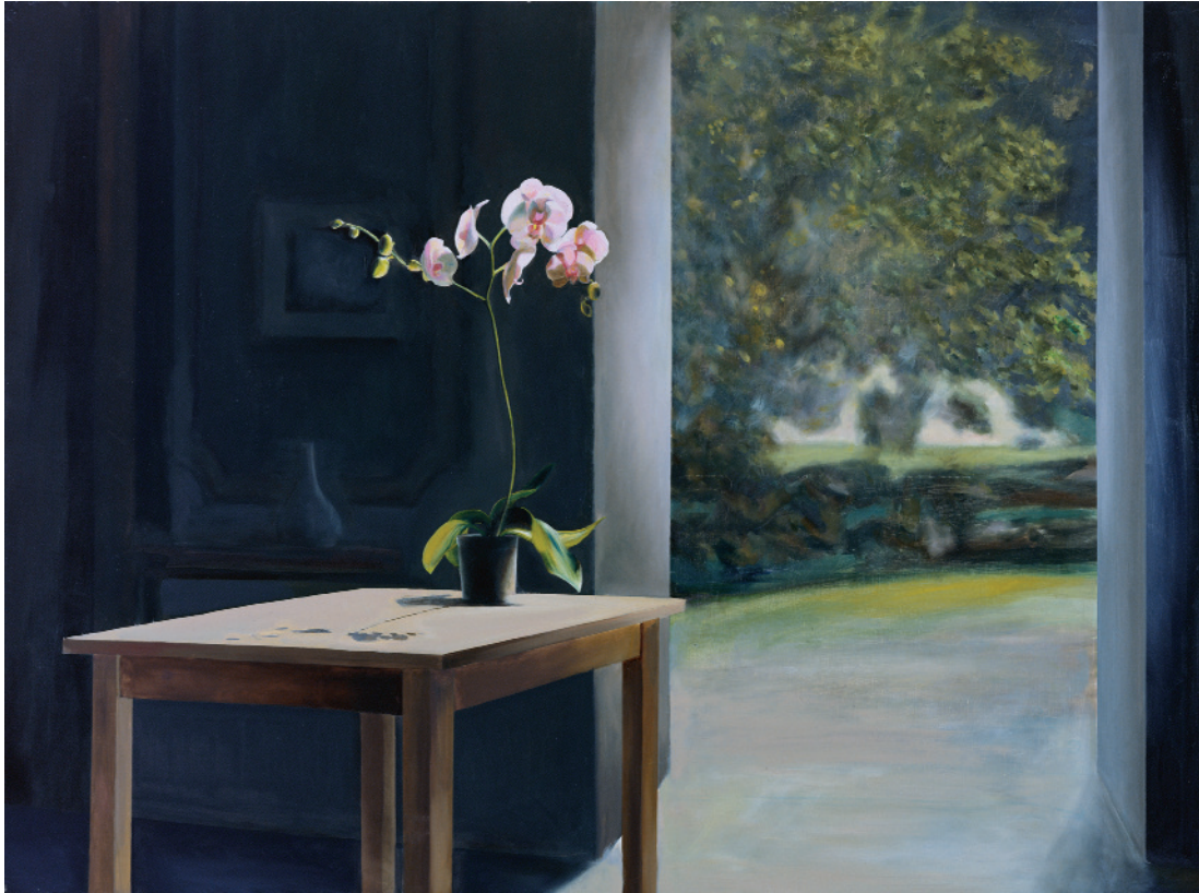
Fleur , 2009 oli sobre tela, 97 x 130 cm, inv. 1350