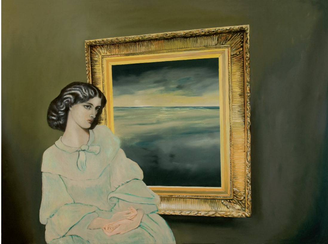
Lits et ratures , 2011 oli sobre tela, 97 x 130 cm, inv. 1416