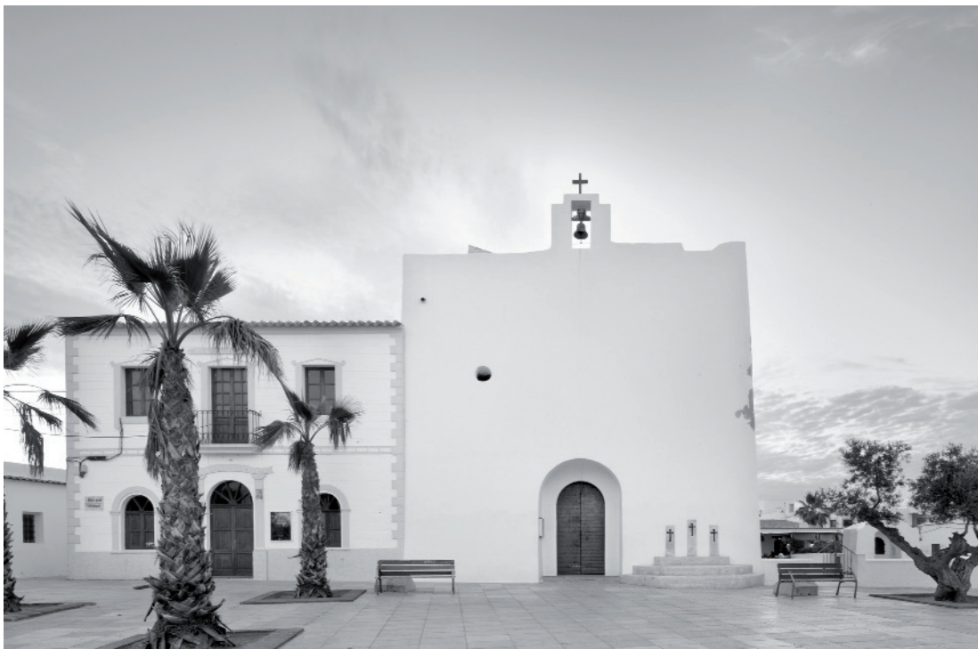
Fotografia Marià Castelló : Ajuntament Vell i Església de Sant Francesc Xavier, Illa de Formentera, Balears.

Portada: L'Énigme verticale , 2011, oli sobre tela, 130 x 97 cm, inv. 1414.